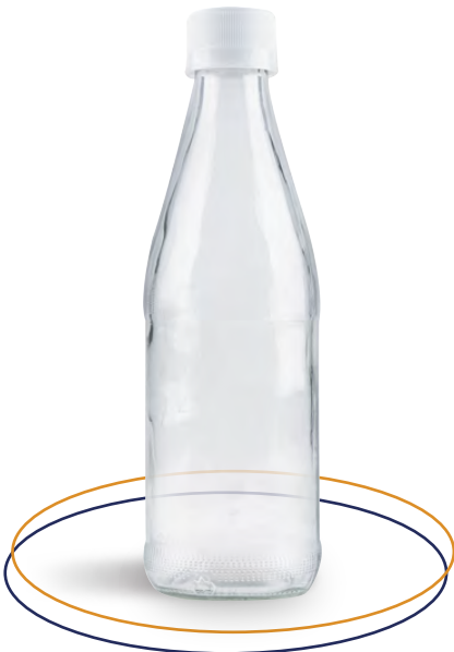
Botella de vidrio 318 ml