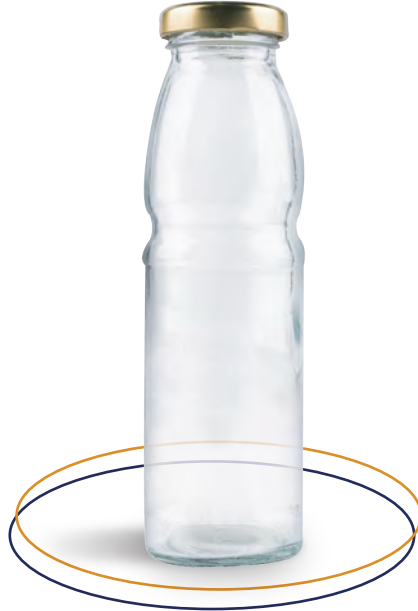
Botella de vidrio 250 ml