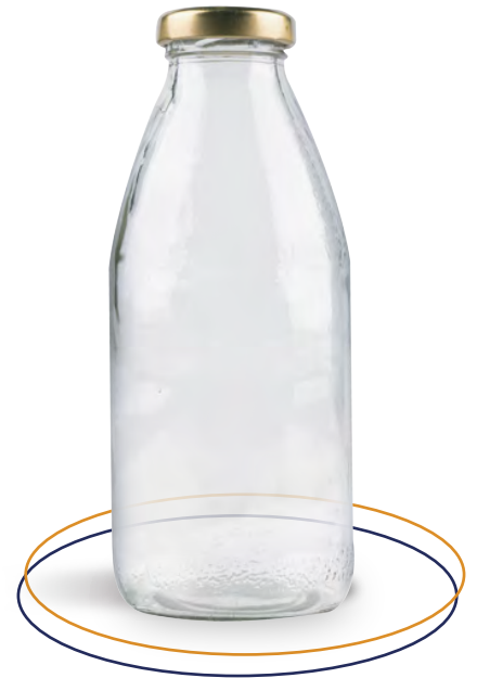
Botella de vidrio 480 ml