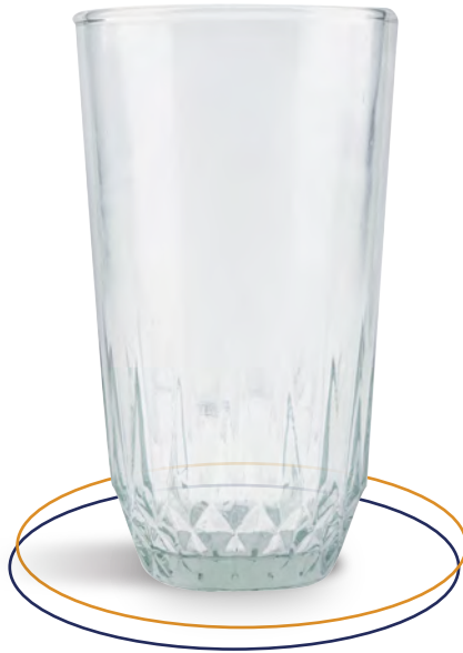
Vaso de vidrio Vaso 12