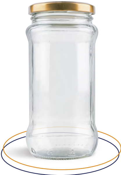
Frasco de vidrio 350 ml