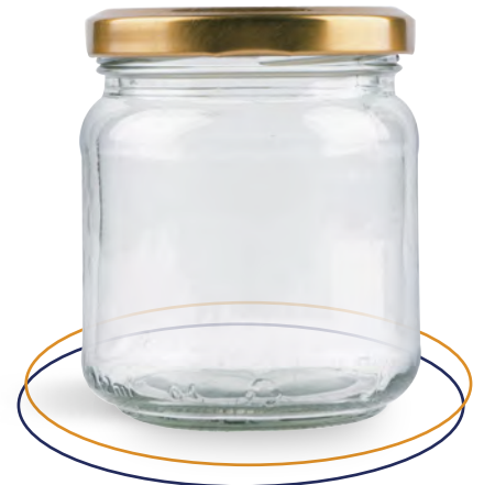
Frasco de vidrio 170 ml