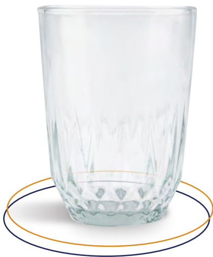
Vaso de vidrio Vaso 8