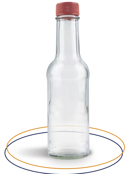
Botella de vidrio 165 ml