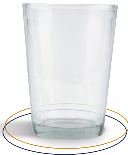
Vaso de vidrio Vaso 9