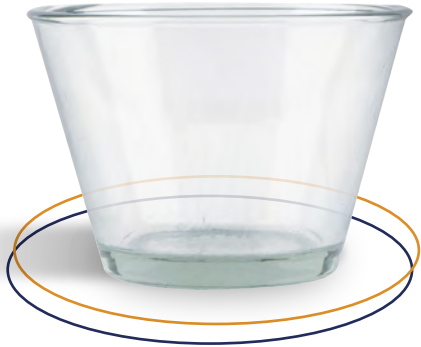
Vaso de vidrio Gelatinera