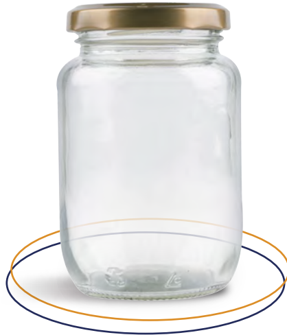
Frasco de vidrio 270 ml