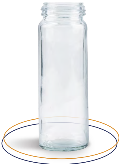
Botella de vidrio 111 ml