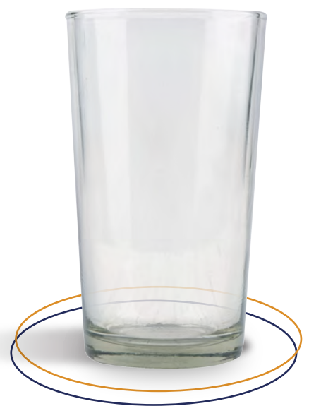
Vaso de vidrio Vaso 11