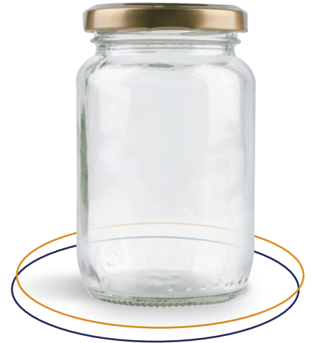
Frasco de vidrio 250 ml