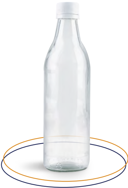
Botella de vidrio 375 ml