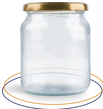
Frasco de vidrio 340 ml