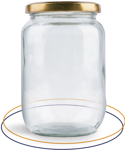
Frasco de vidrio 500 ml