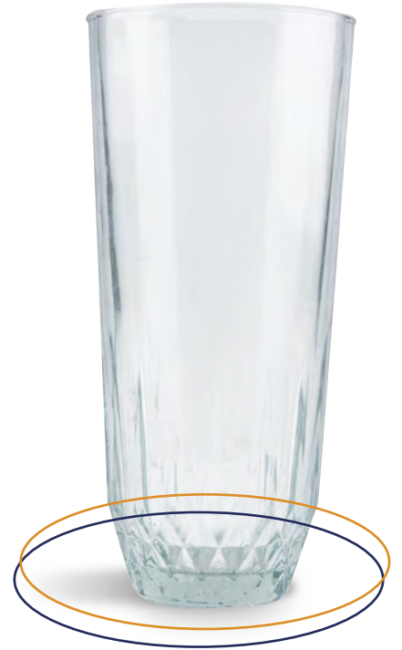
Vaso de vidrio Vaso 15

¿TIENES UN EMPRENDIMIENTO Y NECESITAS ENVASES DE VIDRIO ?